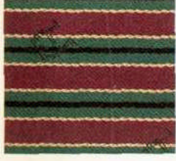
Aigner Streifen Rotgrün