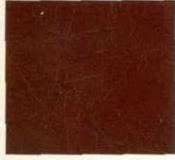
Bordeaux perlfeffekt (Bestellschlüssel: 908211)