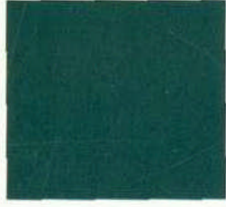
Mangrovingrün metallic (Bestellschlüssel: 997604)