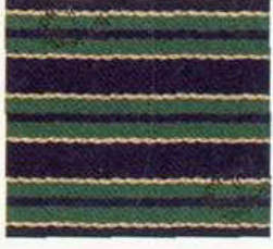
Aigner Streifen Schwarzgrün