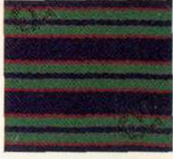
Aigner Streifen Blaugrün