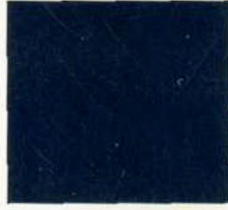
Midnightblue perlfeffekt (Bestellschlüssel: 9990009)